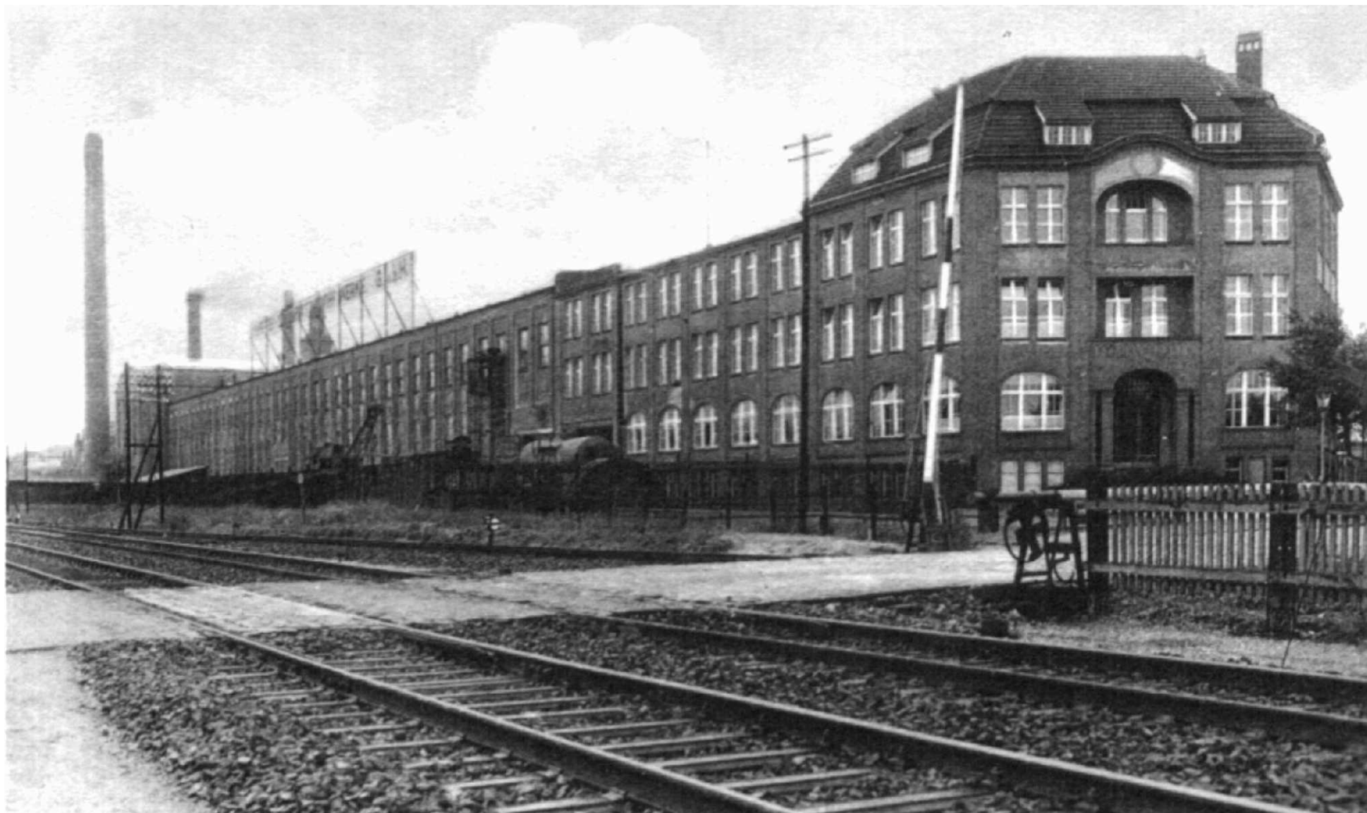
Historisches Foto (datiert 1930)

Ansicht des ehemaligen Maffei-Schwartzkopff-Werkes von Nordosten. Im Vordergrund links die nach dem 2. Weltkrieg zerstörten Werkhallen, rechts die heutigen TGZ- Gebäude.